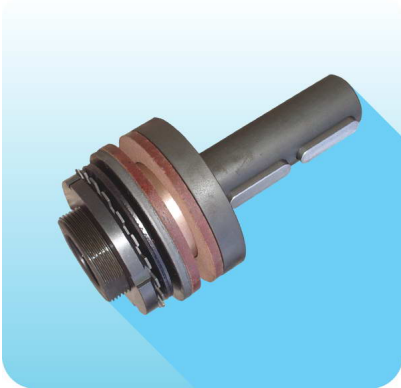
Model met frictieschijven, DF/PR