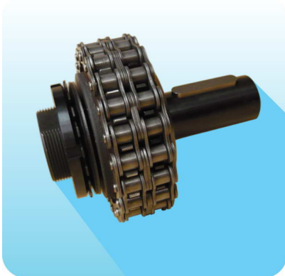
Model met frictieschijven en kettingkoppeling, DF/TAC/PR-V